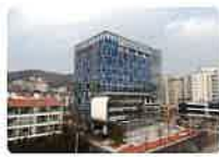
대덕테크비즈니스센터 아이디어기술창업 지원센터